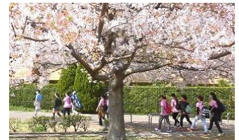
昨年の三ッ池にて

開催日時 3月31日(日) 8:45市場中集合 9時出発 コース 市場中より三ッ池公園迄(三ッ池公園桜満開予定です) ※ お弁当は各自お持ちください。飲み物は町会で用意します！