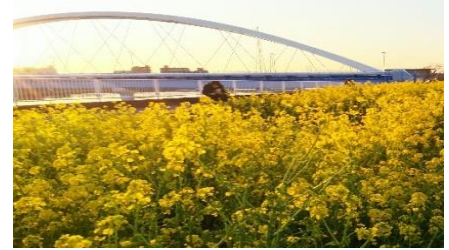
菜の花が満開です・河津桜も満開です！

開催日時 3月3日(日) 10:30~12:00 開催場所 リバーサイドガーデン前(市場中脇) 雨天 市場中学校梅田館に区長をお迎えして開催