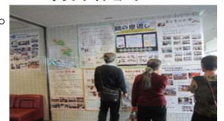
ボランティアコーナー