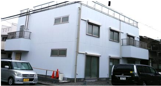
平安町第二会館【??防災福祉ふれあい館】