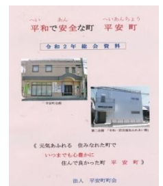
今年の総会冊子をお持ち下さい

※ 総会出席には必ずマスク着用をお願いします！入り口でのアルコール消毒もお忘れなく。