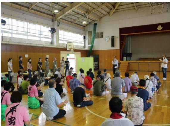
オリエンテーション