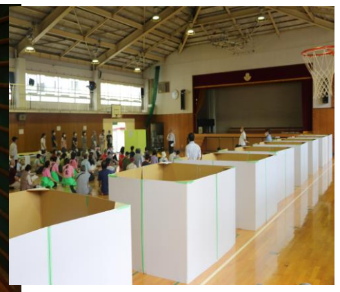
各町 段ボール仕切り