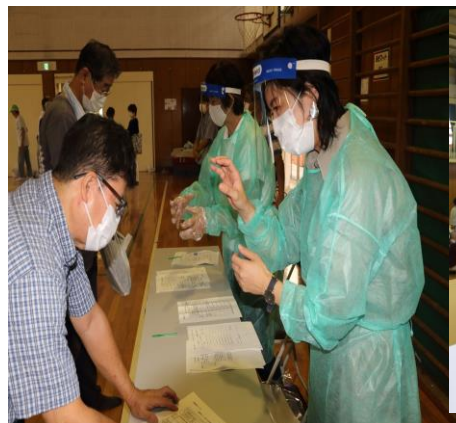
要注意者 受付問診